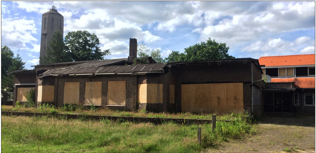
Foto: Het Hotel zoals het er anno juli 2020 bij staat. De geplande renovatie is nu van de baan.