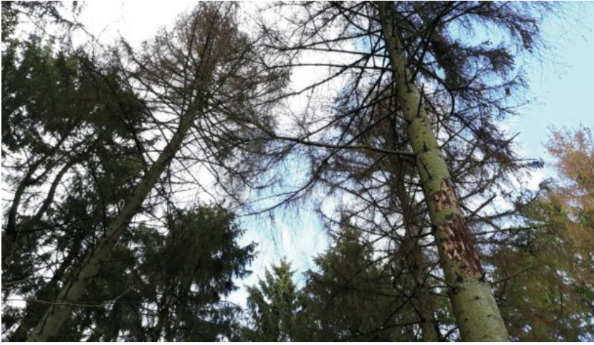
Dode fijnsparren, aangetast door de plaaginsect letterzetter.