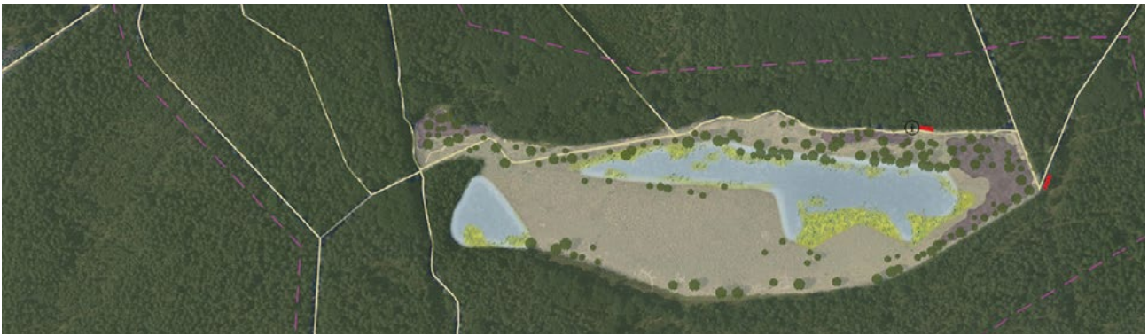
Oude situatie Kootwijkerveen.