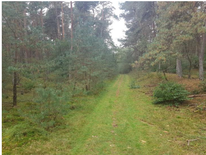
Bospad vlakbij het Heuveltje van 1911, richting het Ossenpad