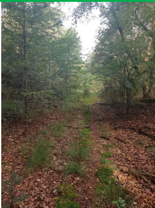
Bospad naar het Heuveltje van 1911 vanuit het zuiden (Harskamp)