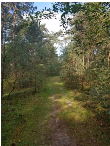
Ossenpad, ongeveer halverwege de Noordheideweg en de Hoog Buurlose weg