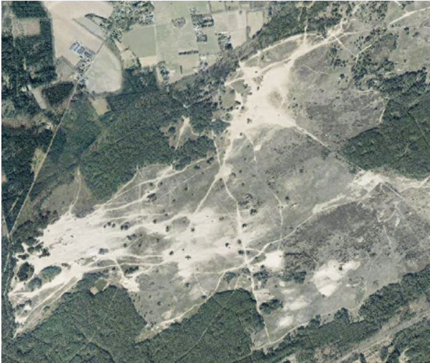
Luchtfoto 2018 voor de eerste fase.