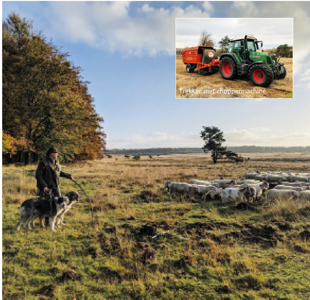
Trekker met choppermachine.

In deze nieuwsbrief leest u over ons bos- en natuurbeheer in uw omgeving. Over natuurherstel op de Veluwe als Natura2000 gebied. Over wat we allemaal buiten in de natuur op de Midden Veluwe doen en waarom. We informeren u over ontwikkelingen vanuit de provincie of Veluwe Alliantie die ons werk raken. En als we prachtige natuurberichten hebben delen we die ook. Heeft u vragen naar aanleiding van of over een ander onderwerp, mail ons dan gerust.