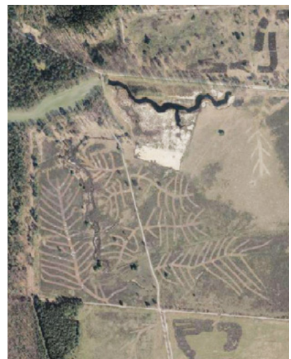
Luchtfoto: Chopperbanen op de Stroesche heide.

De afgelopen maanden hebben we op de Hoog Buurlose heide en de heide rond Radio Kootwijk gechopperd. Chopperen is het verwijderen van de vegetatie en een deel van de bovenste humuslaag. Het is een maatregel tussen maaien en plagen in. Chopperen gebeurt met een robuuste klepelmaaier waarbij de klepels een paar centimeter in de bodem gaan. Het choppermateriaal wordt direct opgezogen en afgevoerd.