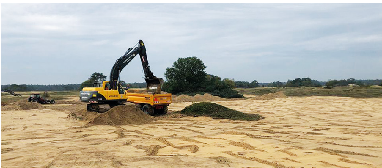
Kootwijkerzand werk in uitvoering winter 2019/2020.

De geplagde bovenlaag blijft in het gebied. Van de werkzaamheden vorig jaar hebben we geleerd dat tankmos snel verteerd en het fijne zand heeft een functie in het stui-