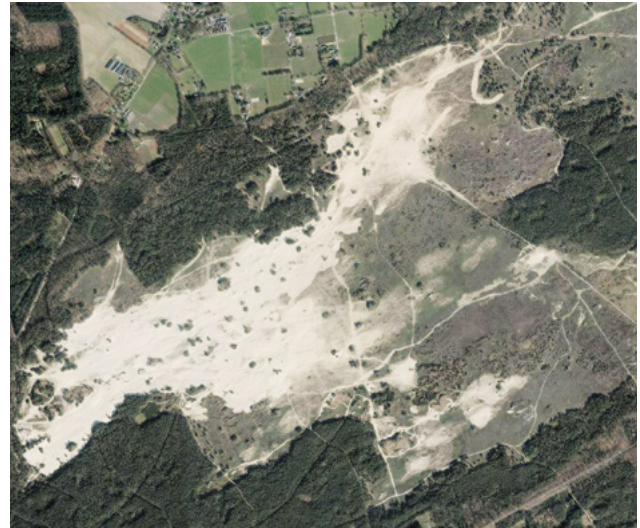
Luchtfoto na de 1ste fase stuifzandherstel begin 2020.

ven. Het geplagde zand wordt in oorspronkelijke laagtes en duinen in het gebied verwerkt. De komende jaren blijven we nog druk met divers natuurherstel op het Kootwijkerzand. Tot 2027 werken we steeds op een ander deel van het stuifzand. Over dit onderwerp zult u hier nog vaker lezen.