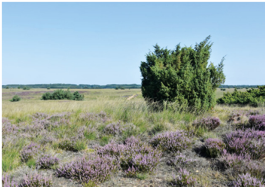
Heide na uitvoering van de werkzaamheden.

Het Kootwijkerzand op de Veluwe is het grootste stuifzandgebied van West-Europa, in totaal 750 hectare. Ruim 120 jaar geleden, al bij het herbebossen van de woeste zandgronden, is het gebied aangewezen als natuurreserveaat. Er hadden zich hier unieke flora en fauna ontwikkeld in het stuivende zand. Maar het gaat niet goed met het open stuifzand. Door te veel stikstof en niet in te grijpen, is het gebied de afgelopen decennia voor een groot deel dichtgegroeid, waardoor flora en fauna die van stuifzand houdt, het moeilijk heeft. Daarom gaan we ook dit jaar weer aan het werk om het zand stuivend te maken. Vogels als boompieper, tapuit, boomleeuwrik en insecten als sneeuwspringer, kleine heivlinder, of de lentevuurspin en met hen nog vele andere dieren gaan profiteren van het stuivende zand. Zij zijn afhankelijk van een sa-