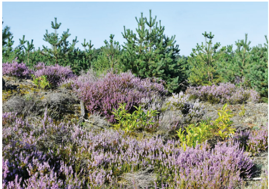
Heide die dicht groeit.

Van nature verandert heide langzaam in bos en beginnen er jonge bomen te groeien. De stikstofdepositie versnelt dit proces. Om de heide te behouden halen we jonge bomen en het opgroeiend bos aan de randen van de heide weg. Er blijven ook kleine en grote bomen op de heide staan voor vogelsoorten als de roodborsttapuit en de nachtzwaluw. Op sommige plekken maken we een open strook die heidegebieden met elkaar verbindt